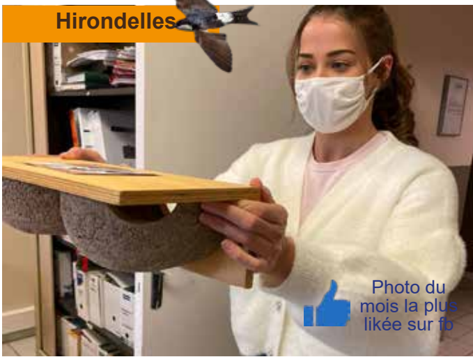
Photo du mois la plus likée sur fb

Les hirondelles, espèce protégée en voie de disparition, aiment notre commune. Pour pallier l'inévitable enlèvement des nids sur deux de nos bâtiments en chantier dont la cantine, des nids artificiels seront posés par les services techniques avec le soutien de la Ligue de Protection des Oiseaux (LPO). Promis, les hirondelles pourront revenir à la maison dès le mois d'avril de retour de leur migration !