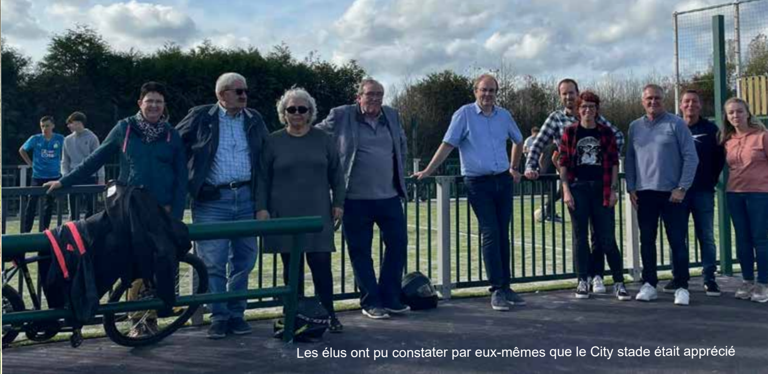
Les élus ont pu constater par eux-mêmes que le City stade était apprécié