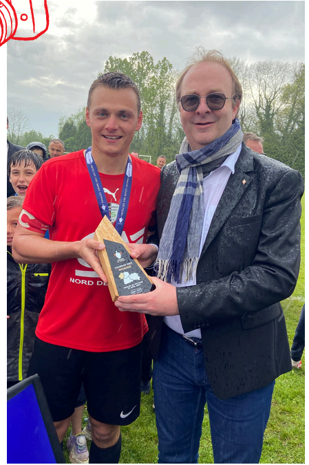
Olympique Senséen Rencontre des U13 à Augsburg en Allemagne