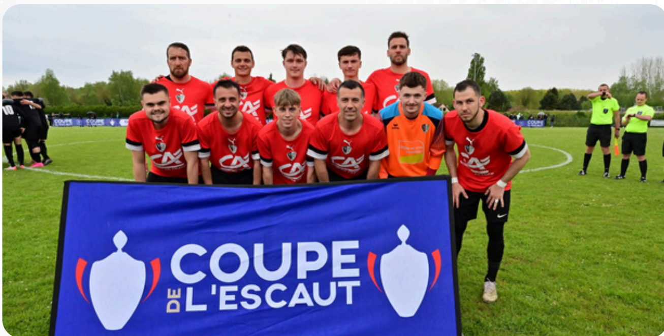
Bravo l'OS - p.2