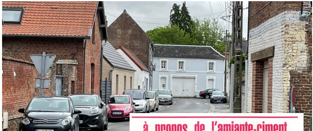
Vue directe sur la rue nonotte.

La ferme des Ailleurs n'est pas très loin et les touristes adeptes de patrimoine en seront, à n'en pas douter, ravis. Le projet devra s'écrire, mais aussi convaincre les financeurs pour rendre possible ce beau projet qui pourrait s'engager début 2026.