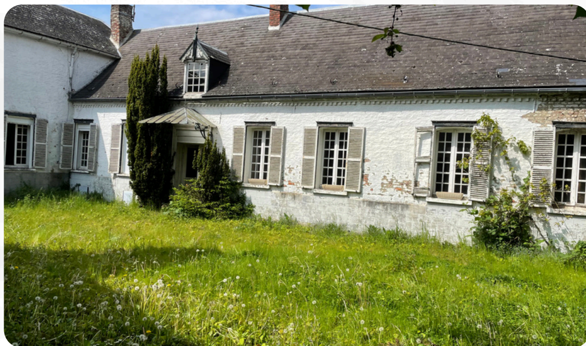
Vers une maison de l'Ail - p.4