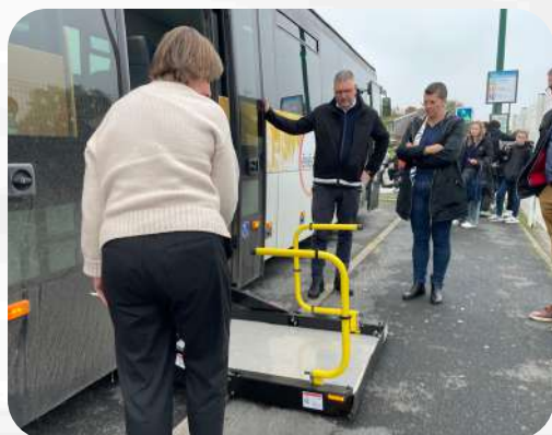
Retour sur l'accessibilité p.4