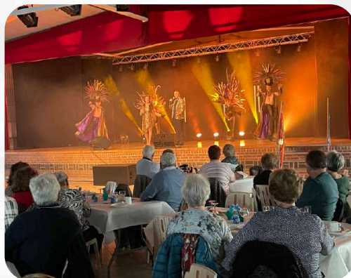
Semaine bleue p.5