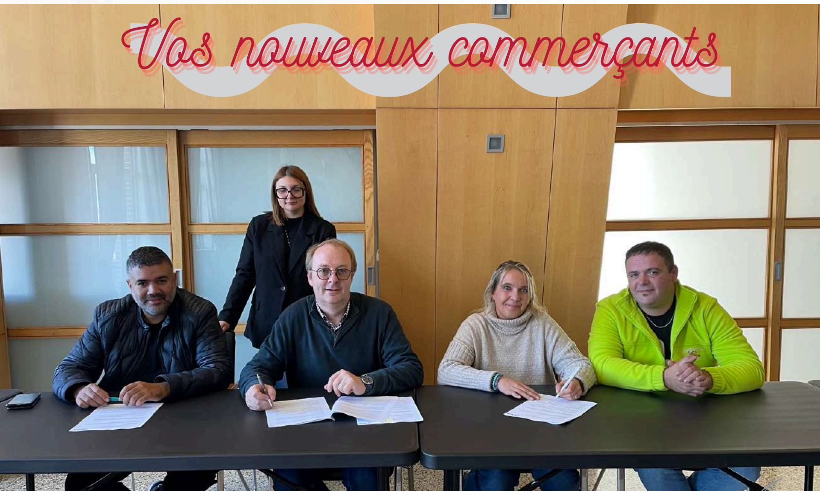
Deux nouveaux baux commerciaux signés en mairie p.3